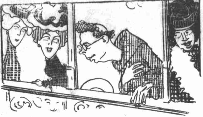
— A minha vida é amar o proximo... ou a proxima, minhas senhoras...

Na Livraria Selles á rua Amador Bueno, 41 e 43, vende-se a Lanterna a 200 réis o numero avulso.